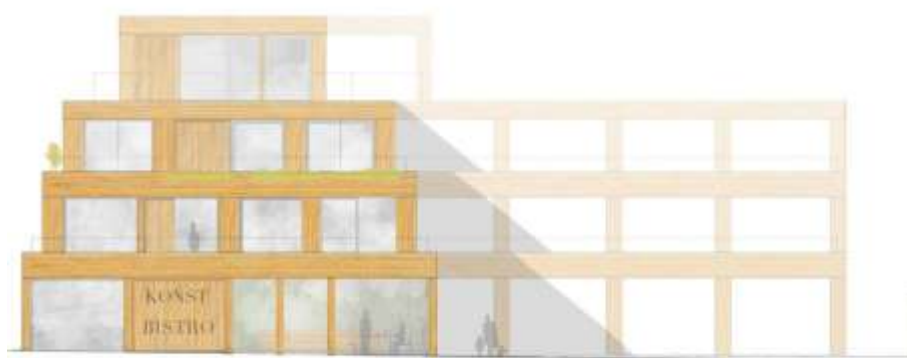
Fasad mot Djurgårdsvägen