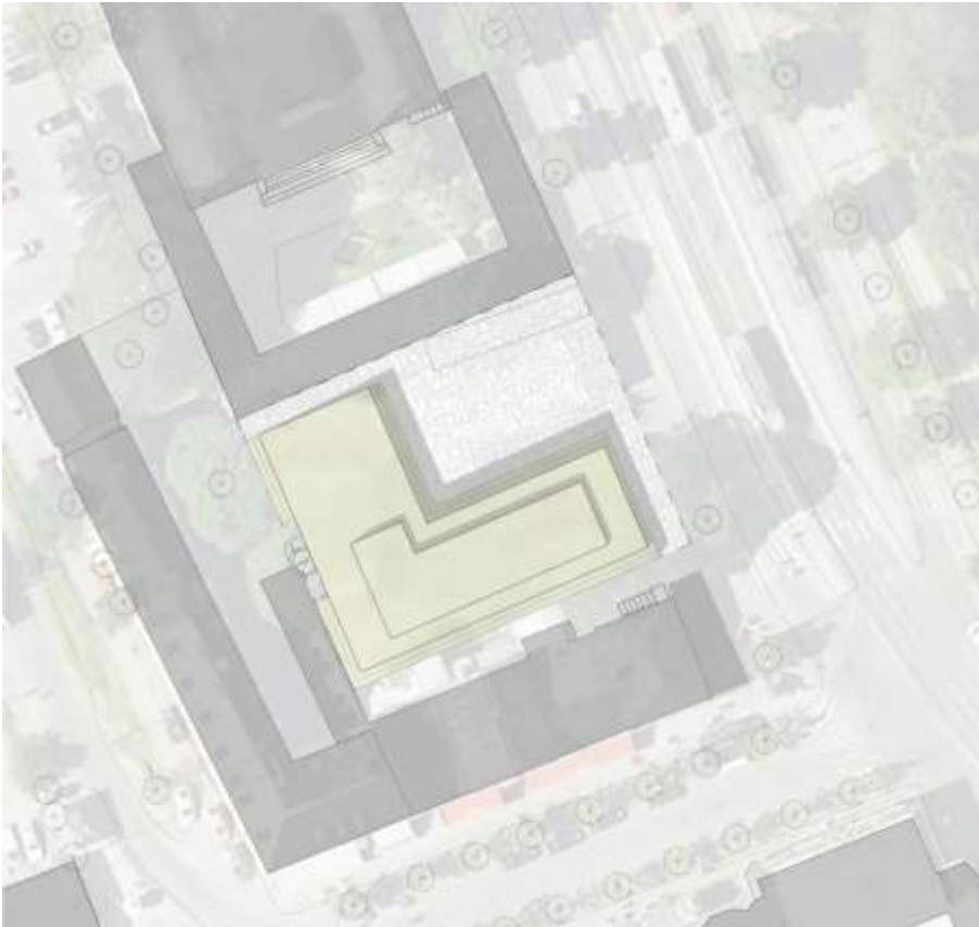
Illustrationsplan över kvarteret Konsthallen