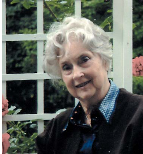
Mammas sista sommar, 1992

Jag skall gå genom tysta skyar Genom hav av stjärnors ljus Jag skall vandra i vita nätter Tills jag finner min Faders hus Jag skall klappa sakta på porten Där ingen mer går ut Och jag skall sjunga av glädje Som jag aldrig sjungit förut