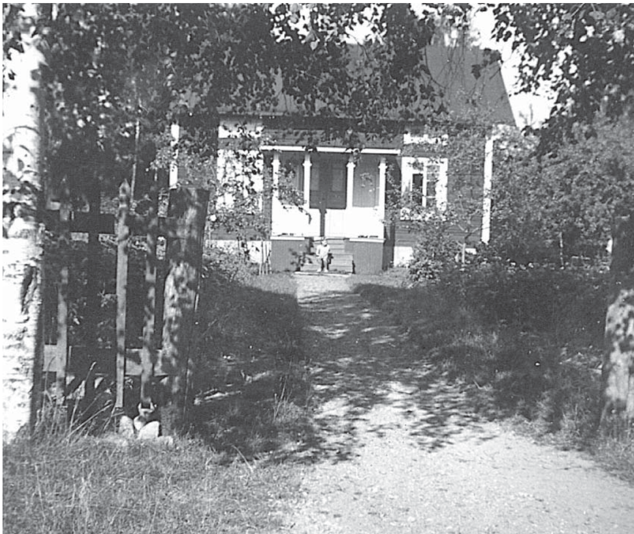
Hemmet i Västerbyn och förmodligen mamma som sitter på trappen, ca 1933.

Barndomens trygga famn får ge efter för spirande drömmar. Vi drivs av våra drömmar och våra liv formas av de första självständiga stegen. När jag sitter och tittar på bilderna får jag en stark känsla av att känna igen hela skeendet, fast en generation senare. Trots att varje människa är unik är många händelser i livet universella och tidlösa.