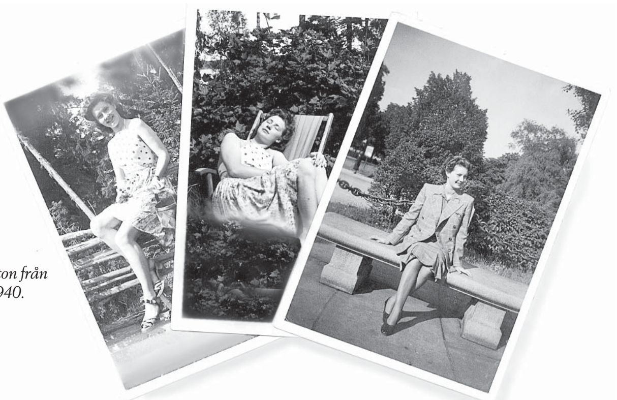
Svit foton från runt 1940.