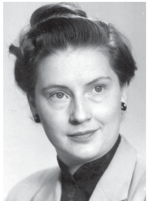
Bilder i från början på 50-talet. Höger bild från 20 maj 1953.