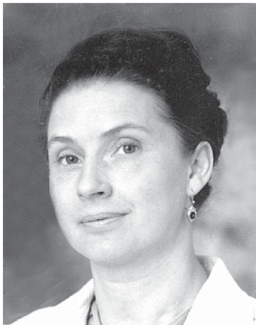
Mammas passfoto 1969.