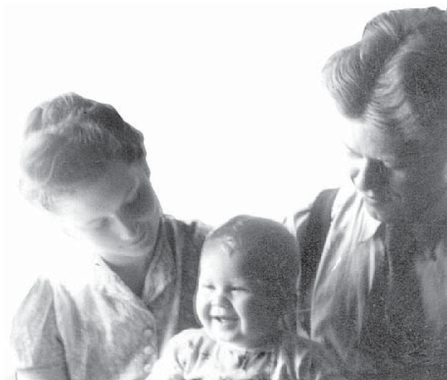
Foto från juli 1944. Jag, första barnet av fyra, föddes 26 sept 1943 i Högalid församling. Staffan föds 1946.